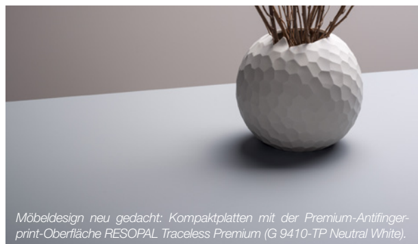
Möbeldesign neu gedacht: Kompaktplatten mit der Premium-Antifingerprint-Oberfläche RESOPAL Traceless Premium (G 9410-TP Neutral White).