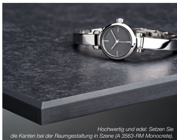
Hochwertig und edel: Setzen Sie die Kanten bei der Raumgestaltung in Szene (A 3563-RM Monocrete).

Die Produkte sind als HPL und Kompaktplatten in unterschiedlichen Stärken und Formaten verfügbar.