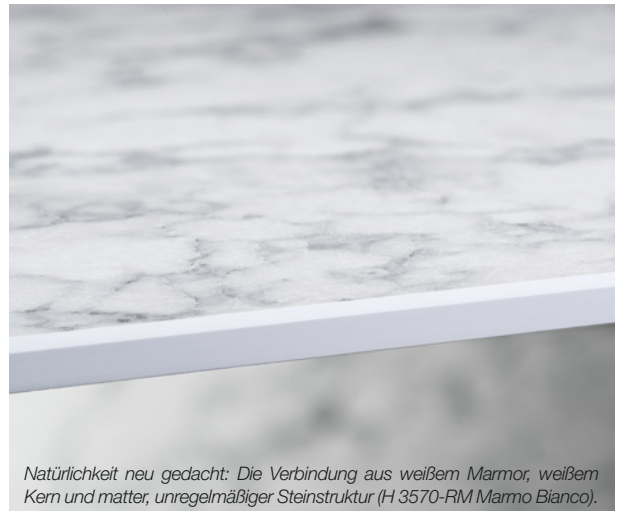
Natürlichkeit neu gedacht: Die Verbindung aus weißem Marmor, weißem Kern und matter, unregelmäßiger Steinstruktur (H 3570-RM Marmo Bianco).