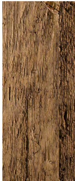
Typ 2B Fichte

Natur, gehackt, stark gebürstet, leicht gedämpft, schönes Wurmbild, leicht rissig.