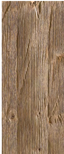
Typ 2A Fichte

Natur, gebürstet, stark gedämpft, intensives Wurmbild, rissig.