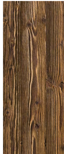
Typ 3B Fichte

Rustikal, gehackt, stark gebürstet, stark gedämpft, intensives Wurmbild, rissig.