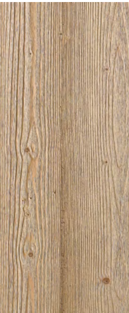
Typ 1B Fichte

Natur, stark gebürstet, leicht gedämpft, schönes Wurmbild, leicht rissig.