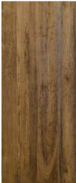
Typ 1D Fichte

Natur, stark gebürstet, leicht gedämpft, schönes Wurmbild, leicht rissig.