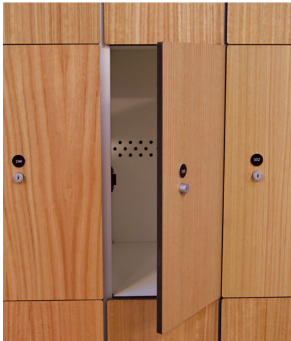
Anwendung: Schließfächer · Fotos: Taquillas Gimnasio Real Aeroclub in Santiago de Compostela, Spanien. Architekt: Carbajo y barrios arquitectos / Juan Pinto.